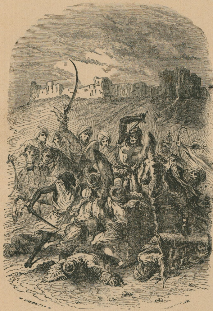
79. — Chevalier attaqué par les musulmans. Een kruisridder door muzulmannen aangevallen.